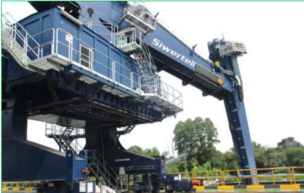
ภาพที่ 1.3 เครื่องจักรลำเลียงถ่านหินจากเรือแบบปิด (Screw Unloader)

การปรับปรุงท่าเทียบเรือของโครงการเป็นการปรับปรุงโครงสร้างท่าเทียบเรือเพื่อติดตั้งเครื่องจักรลำเลียงถ่านหินจากเรือแบบปิด (Screw Unloader) และจะมีการติดตั้งระบบสายพานลำเลียงถ่านหินเพื่อให้เป็นระบบขนถ่ายถ่านหินในระบบปิดโดยสมบูรณ์ ดังแสดงในภาพที่ 1.3