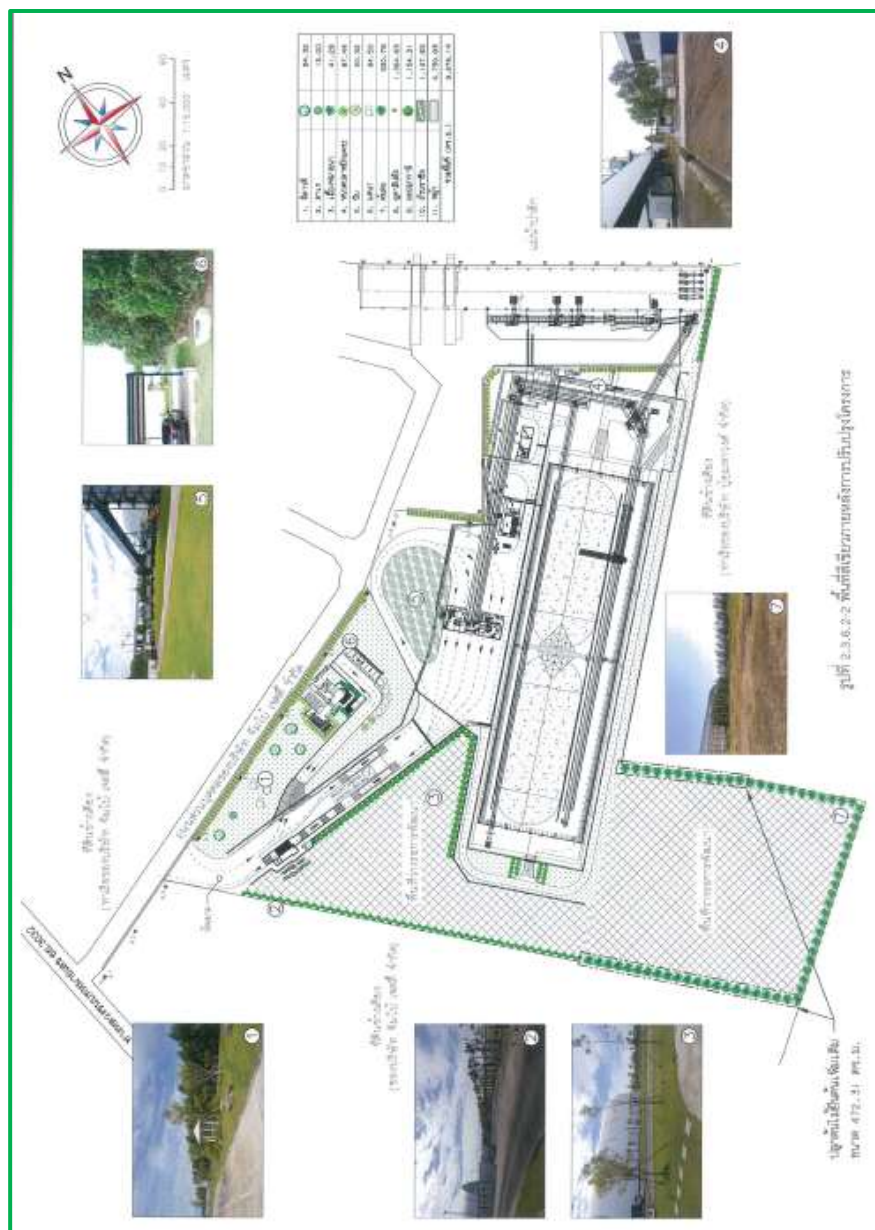
ภาพที่ 1.4 พื้นที่สีเขียวภายในโครงการ

โครงการจะมีการปลูกไม้ยืนต้นบริเวณริมรั้วของพื้นที่ที่รอการพัฒนาของโครงการเพิ่มเติม ขนาด 472.31 ตารางเมตร ความยาวประมาณ 160 เมตร โดยเลือกชนิดพันธุ์ที่มีใบหนา ทนทานต่อสภาพแวดล้อม เช่น สน มะฮอกกานี ยูคาลิปตัส เป็นต้น ปลูกสองแถวสลับฟันปลา ระยะห่างระหว่างต้นและแถวประมาณ 2 เมตร ดังนั้น จึงมีพื้นที่สีเขียวภายหลังการปรับปรุงโครงการรวมทั้งเท่ากับ 9,678.14 ตารางเมตร ดังแสดงในภาพที่ 1.4