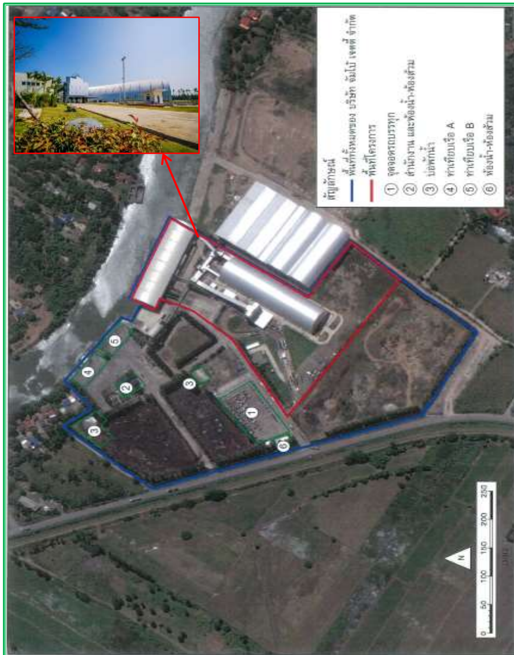
ภาพที่ 1.1 ขอบเขตพื้นที่โครงการ